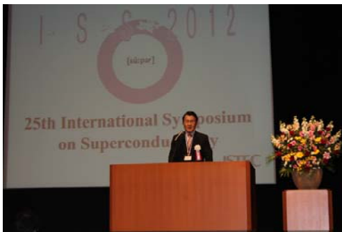
開会挨拶 組織委員長

本シンポジウムの開催状況については、電子情報誌「超電導 Web21」の特集号として掲載し、広く情報提供を行った。